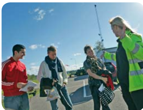
Övningsmomenten varvas med diskussion/utvärdering

Vi följer Transportstyrelsens och Trafikverkets (fd. Vägverket) regler för godkänd legitimation. För aktuell information besök www.korkortsportalen.se eller kontakta Trafikverket. För att se de godkända legitimationer som gällde vid tryck av övningshäftet juni 2011, se sidan 5.