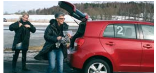
Trafikskoledagen den 12 mars