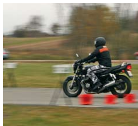
Utbildning av Riskutbildningslärare på Stora Holms Trafikövningsplats den 22 oktober 2009.

Information om utbildningen kommer löpande att uppdateras på vår hemsida. Där finns redan nu nedladdningsbara informationsblad om utbildningarna, information om utrustning och motorcyklar mm: www.storaholm.se